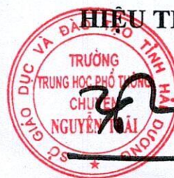
Trịnh Ngọc Tùng

Chú ý: Lịch trên có thể thay đổi tùy theo các thông báo của cấp trên, đề nghị các đồng chí theo dõi thường xuyên trên hệ thống tin nhắn của nhà trường.